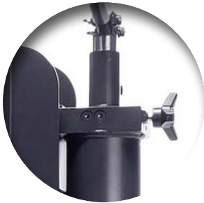
◀ Hydraulische tweektrapspomp