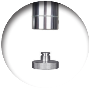
◀ Snelwissel opname dop