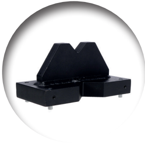
◀ Multifunctionele persblokken